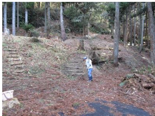
落葉除去：ガーデンへのアプローチ階段