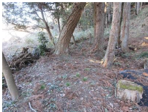
草刈整備：用水路跡の堤防