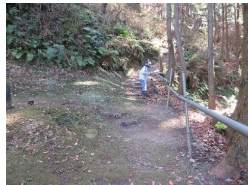
落葉除去：1号墓～2号墓の見学路