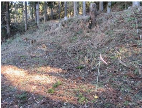
ガーデンの斜面：放置材を撤去し草刈整備