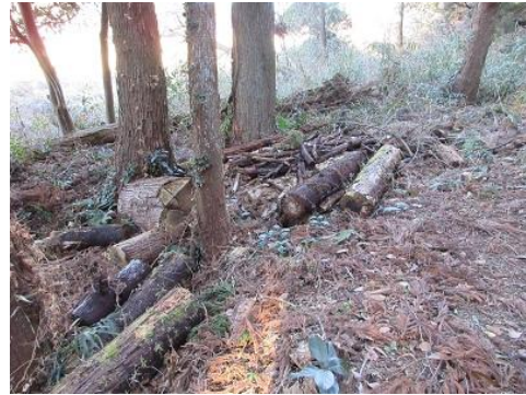
放置材を集積：用水路跡の窪地