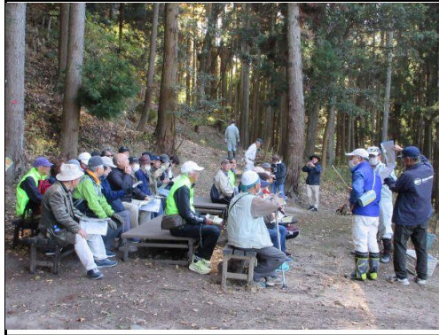
「かんぶり穴」概要説明：ガーデンにて