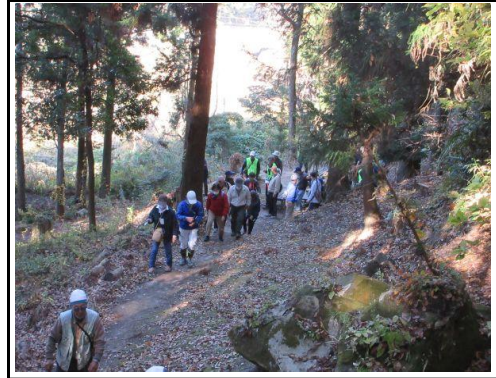
横穴墓見学スタート：1号墓へ向かいます