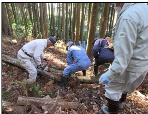
見学会終了後、杉林内の倒木処理：玉切り