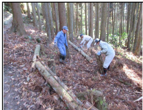
杉林内の倒木処理：玉切りして路肩に集積