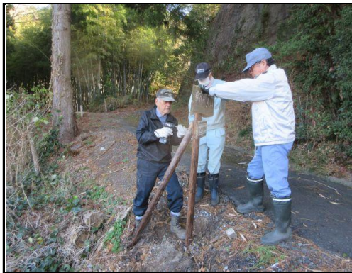
「横穴群入口」看板の設置：補強支柱取付け