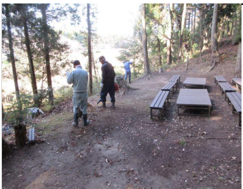
杉枝・落葉類の除去：ガーデン一帯