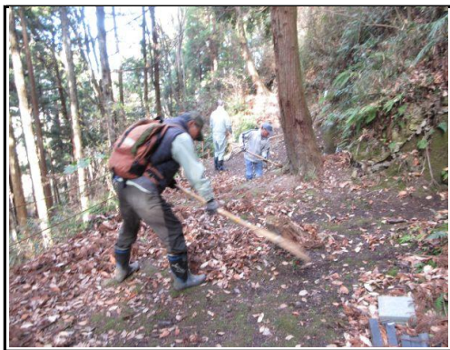
杉枝・落葉類の除去：14号墓前～16号墓前