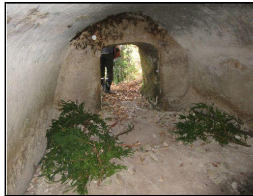
ゲジゲジ対策：20号墓にヒノキ枝を入れました