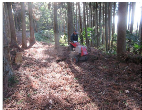
落下杉枝類の粉砕：メイン通路