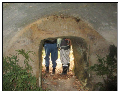
本日・1/17（土）：20号墓の状況