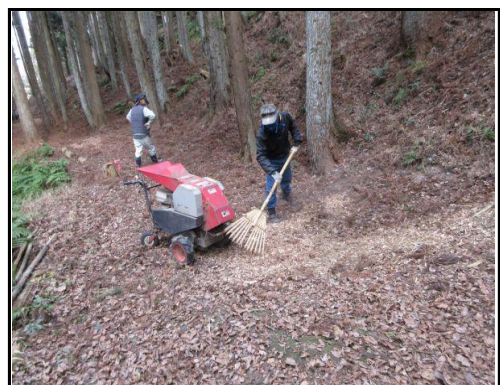
粉碎チップの散布