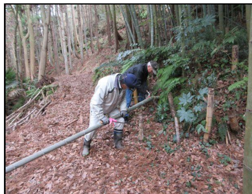
倒れた孟宗竹の伐採処理